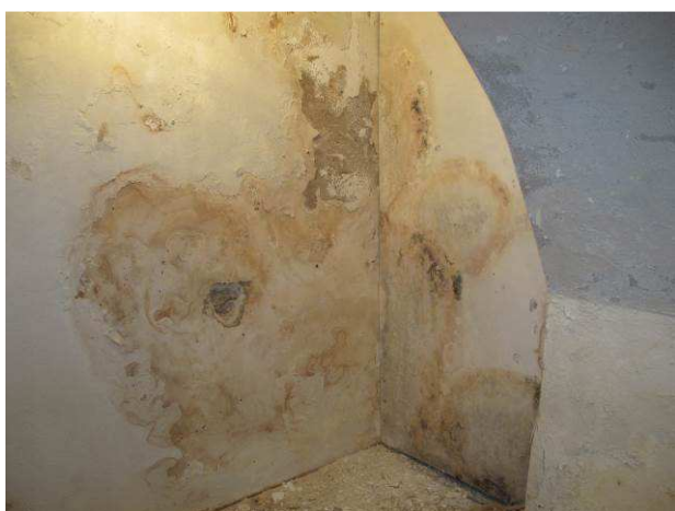
Foto č.27 – výskyt vlhkostních map se solnými výkvěty na omítkách a výskyt plísní na sádrokartonových předstěnách