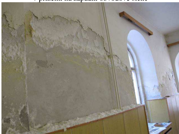
Foto č.11 – detail solných výkvětů na západní obvodové stěně v přízemí objektu