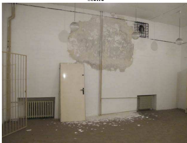
Foto č.16 – lokální místo vlhkosti v přízemí pod stropem vlivem dlouhodobého zatékání při dešťových srážkách