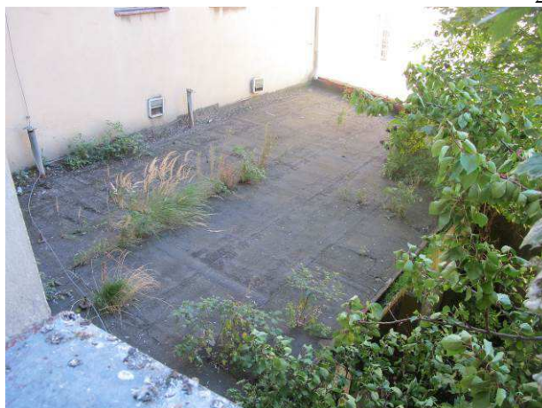
Foto č.8 – pohled na stávající dvorní přístavek z druhého patra objektu s hojným výskytem dřevin a travin v prostoru dvora