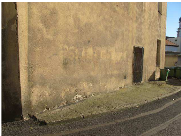
Foto č.5 – pohled na jižní fasádu posuzovaného objektu s charakterem přilehlé pochůzí plochy