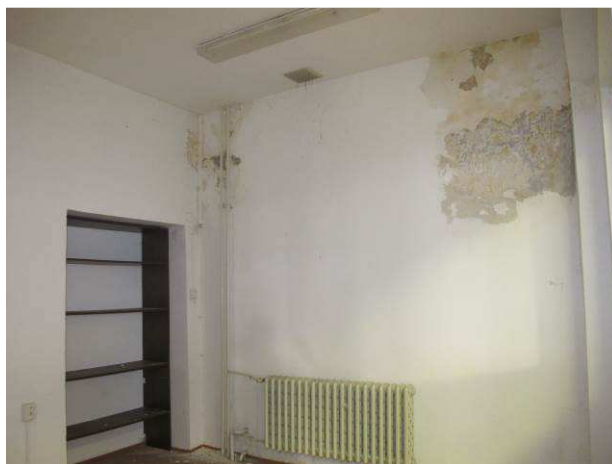
Foto č.12 – lokální místa vlhkosti v přízemí pod stropem vlivem dlouhodobého zatékání při dešťových srážkách