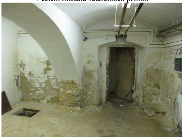
Foto č.21 – degradace omítkových systémů na vnitřních stěnách suterénu