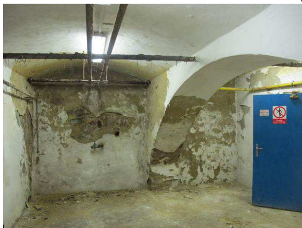
Foto č.20 – degradace povrchových úprav prakticky v celém rozsahu suterénních prostor