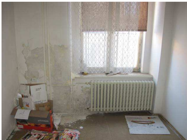
Foto č.13 – degradace omítek se solnými výkvěty v přízemí na severní obvodové stěně