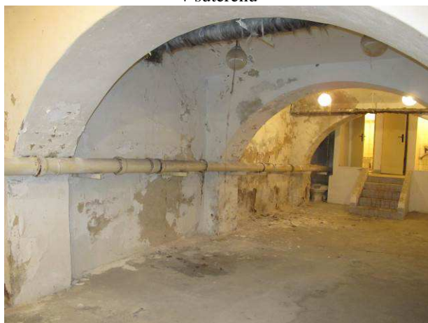
Foto č.24 – degradace omítek v suterénu na východní obvodové stěně