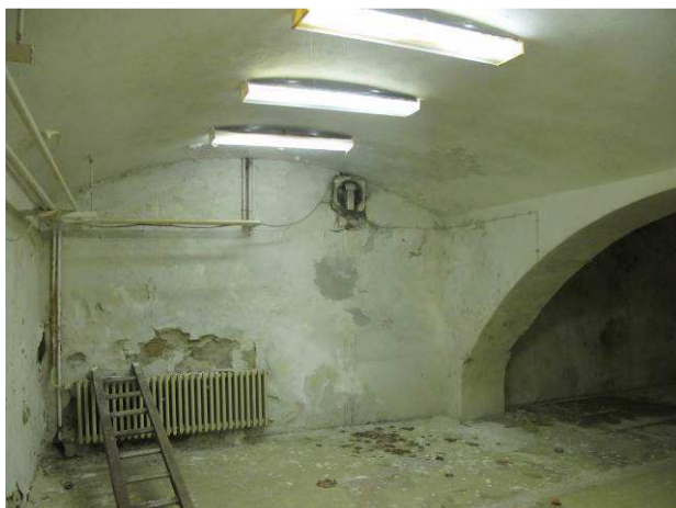
Foto č.19 – degradace povrchových úprav prakticky v celém rozsahu suterénních prostor