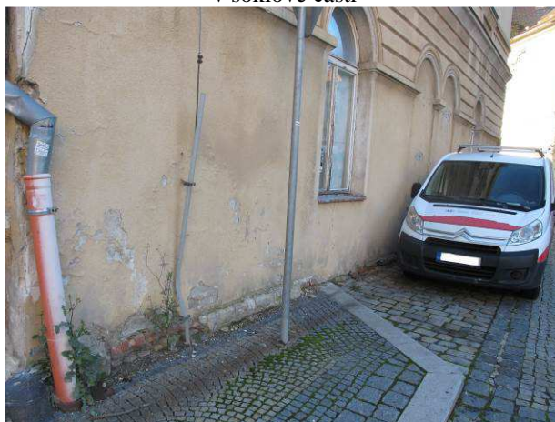
Foto č.4 – pohled na část západní fasády s viditelnými vlhkostními projevy