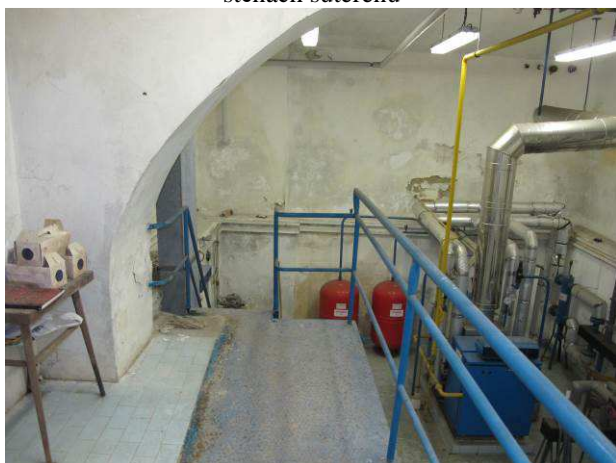
Foto č.23 – vlhkostní projevy formou vlhkostních map se solnými výkvěty v prostoru kotelny