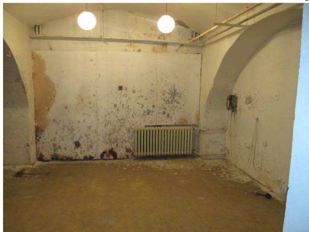
Foto č.26 – výskyt plísní na předstěně ze sádrokartonu vlivem vysoké vnitřní relativní vlhkosti v kombinaci se vztlínající zemní vlhkostí