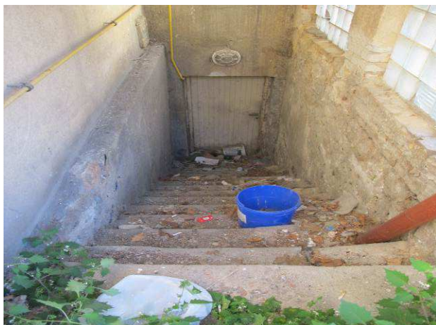
Foto č.7 – pohled na vnější vstupní schodiště do suterénu nacházející se na východní straně objektu