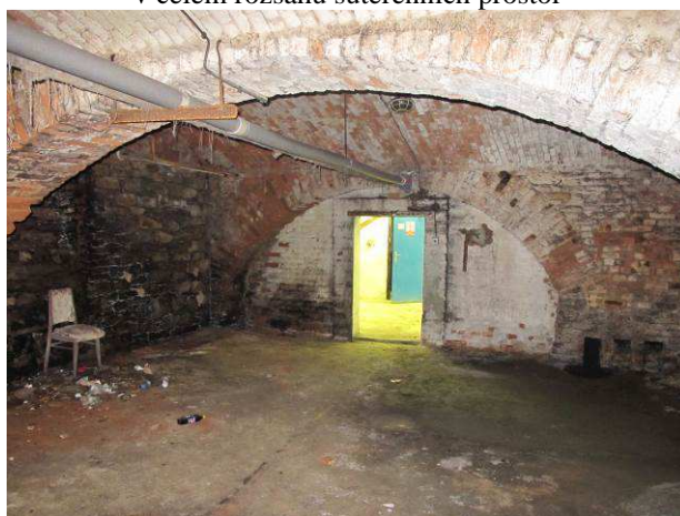
Foto č.22 – charakter obvodových a vnitřních konstrukcí v suterénu