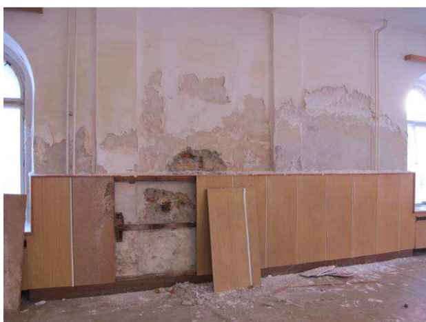
Foto č.9 – degradace omítek se solnými výkvěty v přízemí na západní obvodové stěně